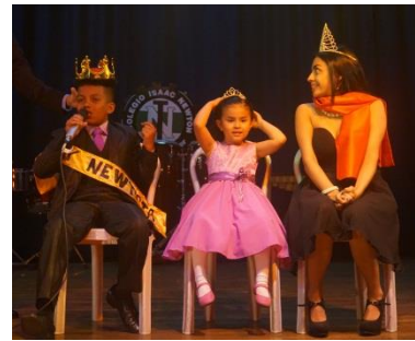
REYES NEWTISTAS 2016