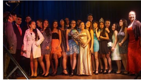
GANADOR DE GANADORES BTO 2016 ANDOKE