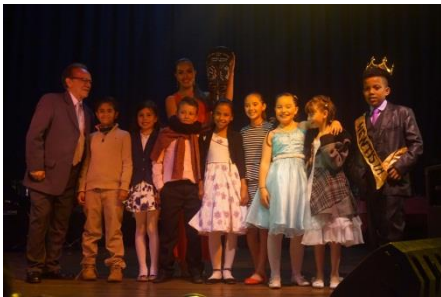
MEJOR COMPARSA PIA 2016 CUARTO