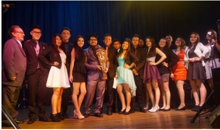
MEJOR COMPARSA BTO 2016 SIKUANI